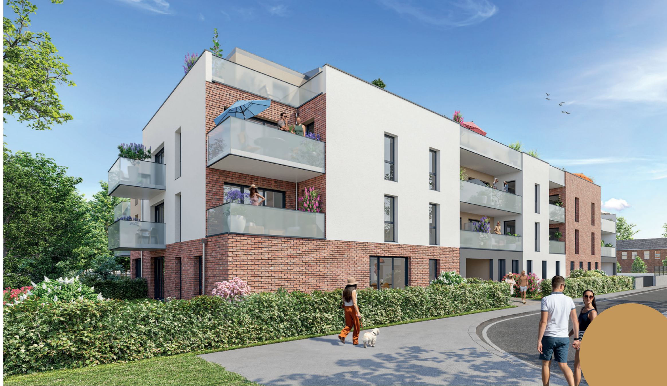
Visuel non contractuel.

Avec ses nombreux commerces, services de proximité et complexes sportifs, soutenue par des projets immobiliers majeurs et un dynamisme économique croissant, Déville-lès-Rouen est en pleine expansion. Autant d'atouts qui en font une adresse de choix pour de nombreux ménages, jeunes actifs et étudiants.